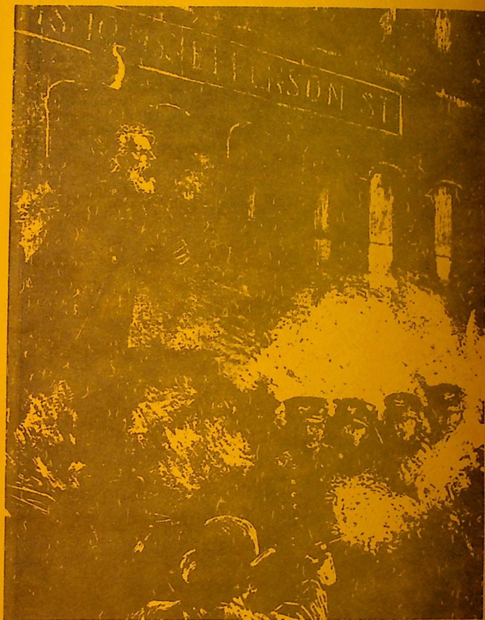
Le 1er Mai à Chicago en 1885.